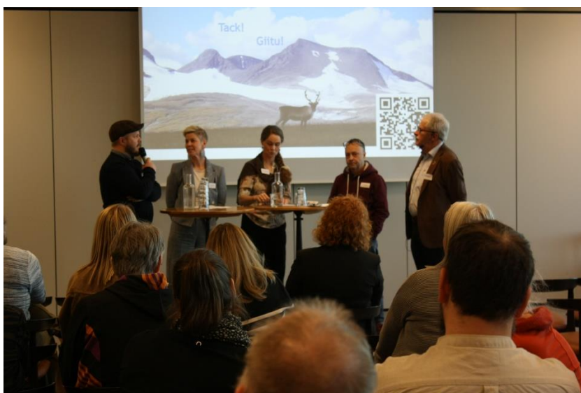
Foto 6: Panelen diskuterar den gröna omställningens utopi och konsekvenserna av denna idé.

I relation till den gröna omställningen får renskötarna ofta kommentaren att ”vi tar ju bara det här området”, som att man inte förstår att hela landskapet hänger ihop, och att förändringar på ett ställe kan förändra förutsättningarna på många andra ställen. Om renarna tvingas stanna på sämre marker kan det få stora konsekvenser.